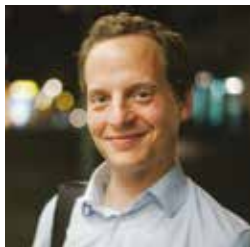
Sebastian Muders © DR