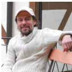
«Kriege, Ketzer...» mit Werner Bellwald