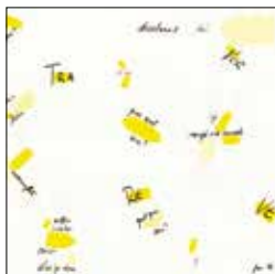
Détail «La Feuille» © Sophie Mentha, 2019

Annick Vermot vous livre les secrets de l'aquarelle. Inscription: mv-sion-mediation@admin.vs.ch. Durée: 1h Samedi 13 avril, salle de conférences, à 14h00