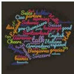
Wordcloud © Mediathek Wallis

Español: Samstag 15. und 29. Juni, 11.00 - 12.00 Uhr