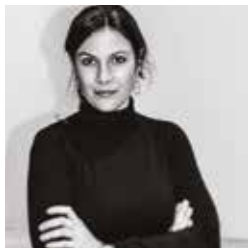
Barbara Terpoorten © Soblue Weina