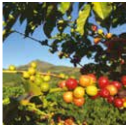
Fruits de caféiers

Avenue du Simplon 6 - 027 607 15 80 mv-stmaurice-mediation@admin.vs.ch www.mediatheque.ch