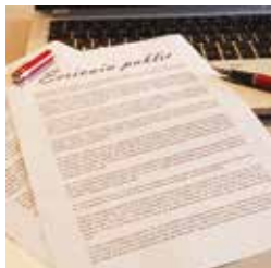
Un écrivain à votre service