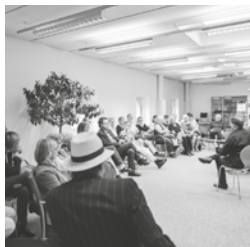
Literarischer Salon