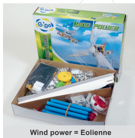
Wind power = Eolienne