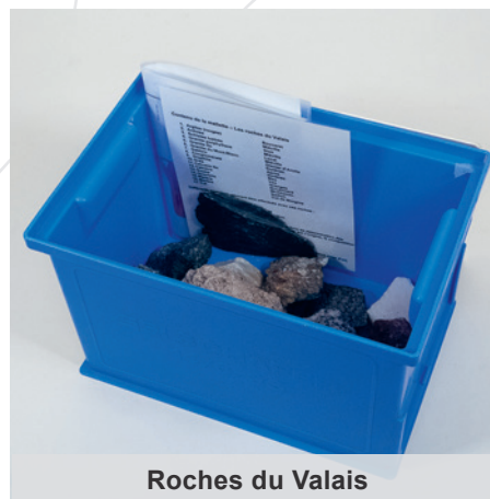
Roches du Valais