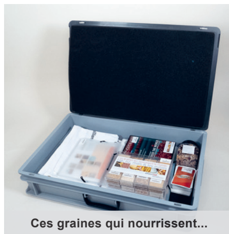
Ces graines qui nourrissent...

Degrés : 1H-11H Localisation : St-Maurice niv. 3 Cote : 598.2 VOGÉ Code-barres : 1011373421, 1011373422 Localisation : Sion dépôt 1 Cote : 800.73 VOGÉ Code-barres : 1010655512