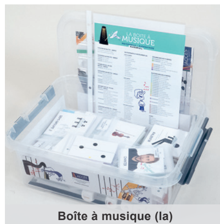
Boîte à musique (1a)