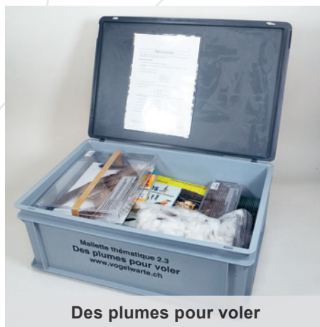
Des plumes pour voler