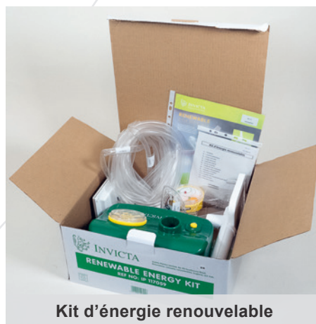
Kit d'énergie renouvelable