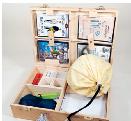
Insieme fait la classe !