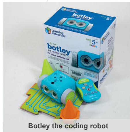
Botley the coding robot

Degrés : 1H-8H Localisation : St-Maurice niv. 3 Cote : 004.42 BOTL Code-barres : 1012096368 Localisation : Sion dépôt 1 Codes-barres : 1010655050