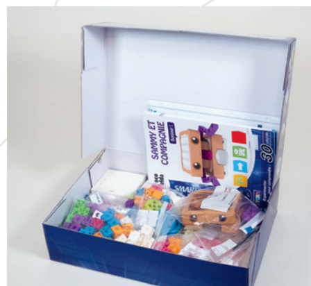
Kids first : coding & robotics