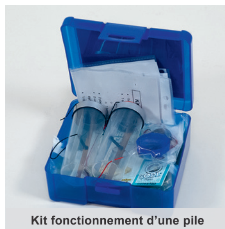
Kit fonctionnement d'une pile

Degrés : 2H-9H Localisation : St-Maurice niv. 3 Cote : 537(072) BUIL Code-barres : 1012066520 Localisation : Sion dépôt 1 Codes-barres : 1012129196