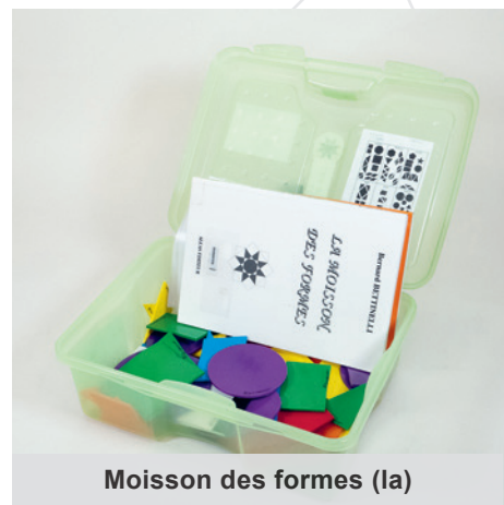
Moisson des formes (Ia)

Degrés : 7H-11H Localisation : St-Maurice niv. 3 Cote: 51-8 BETT Code-barres: 1010282315, 101028233, 1010282321, 1010282325, 1010282323, 1010282316, 1010601938, 1010601939, 1010282314, 1010282312 Localisation : Sion dépôt 1 Code-barres : 1010631920, 1010631898