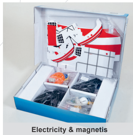
Electricity & magnetis