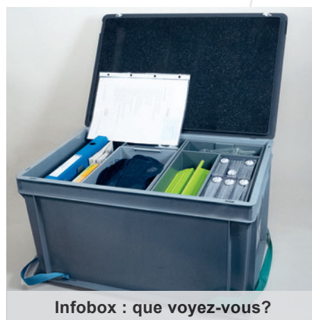
Infobox : que voyez-vous?

Degrés : 2H-7H Localisation : St-Maurice niv. 3 Cote: 364.2 INSI Code-barres: 1010976235, 1010976236 Localisation : Sion dépôt 1 Code-barres : 1011182952