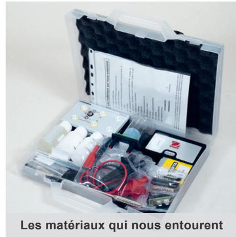
Les matériaux qui nous entourent

Degrés : 8H-11H Localisation : St-Maurice niv. 3 Cote : 539(072) MATE Code-barres : 1012096356 Localisation : Sion dépôt 1 Codes-barres : 1012129125