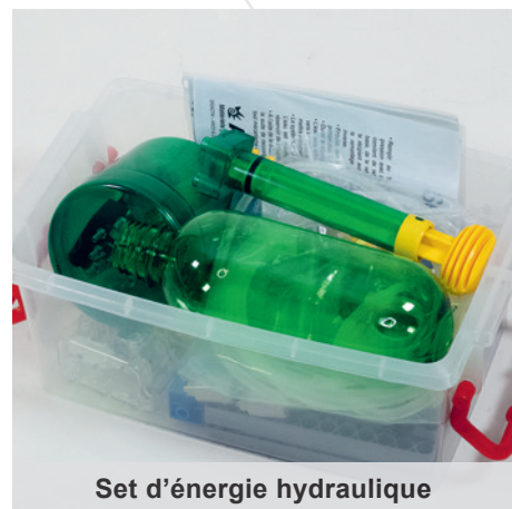
Set d'énergie hydraulique