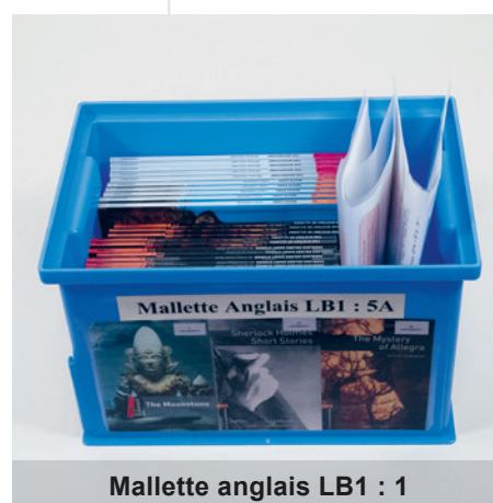
Mallette anglais LB1 : 1