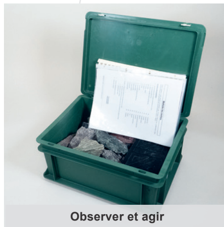
Observer et agir

Degrés : 1H-11H Localisation : St-Maurice niv. 3 Cote : 552(494) ROCH Code-barres : 1010972677 Localisation : Sion dépôt 1 Code-barres : 1010626583, 1010626579, 1010282374,