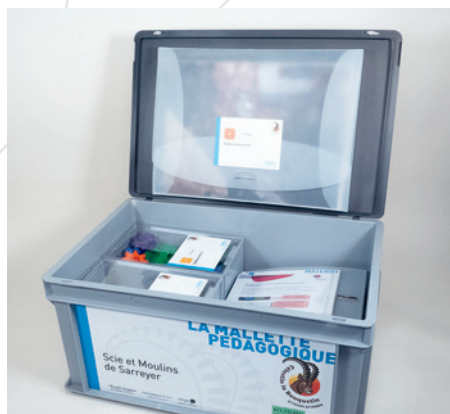
Scie et moulins de Sarreyer