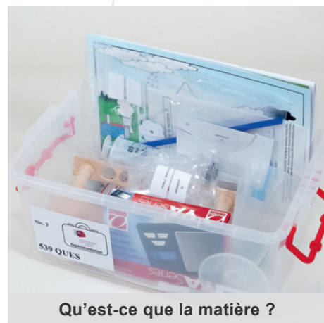
Qu'est-ce que la matière ?

Degrés : 5H-7H Localisation : St-Maurice niv. 3 Cote : 539 QUES Code-barres : 1012096369