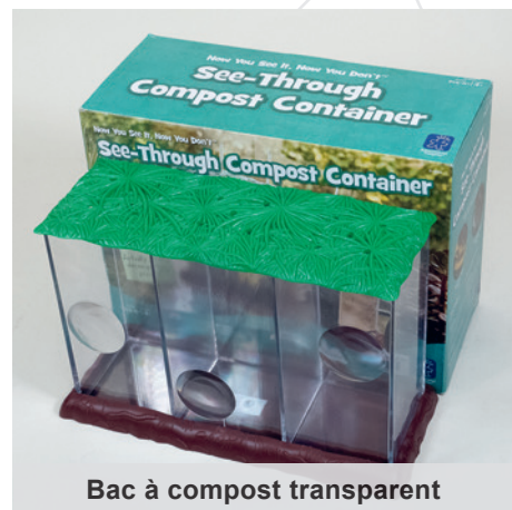
Bac à compost transparent

Degrés : 1H-8H Localisation : St-Maurice niv. 3 Cote : 532(072) SETD Code-barres : 1012096367 Localisation : Sion dépôt 1 Codes-barres : 1010655047