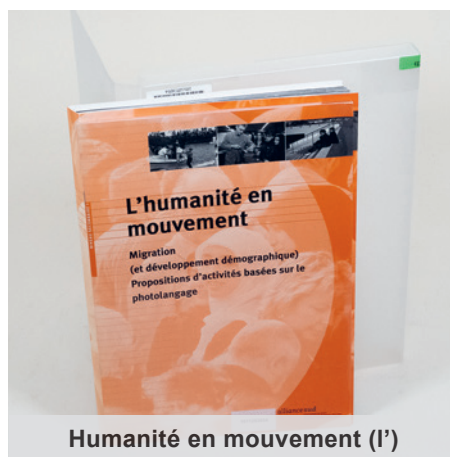
Humanité en mouvement (I')