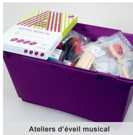
Ateliers d'éveil musical