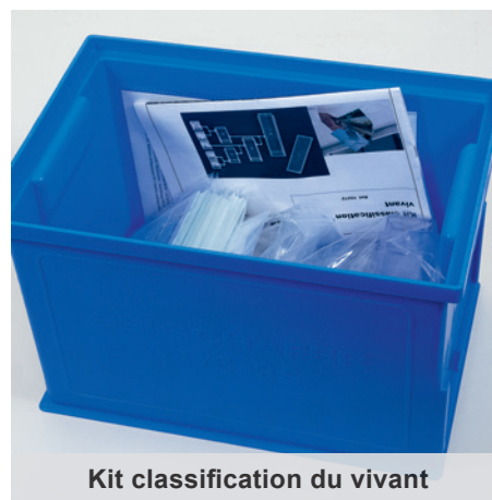
Kit classification du vivant