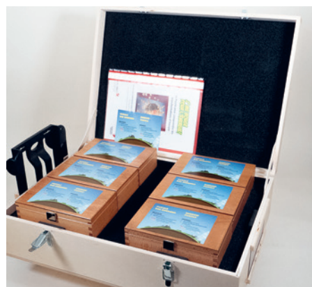
J'me bouge pour l'énergie !